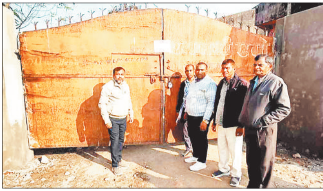
अवैध धान लोड गाड़ी एवं राइस मिल के गेट पर सील बंदी करते खाद्य विभाग के अधिकारी।