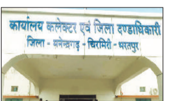
पीड़िता का दर्द अब कहां जाऊं

जनता के शिकायतों का त्वरित निराकरण के लिए जिला स्तर पर कलेक्टर की अध्यक्षता में कलेक्टर जनदर्शन कार्यक्रम आयोजित किया जाता है, जहां विभिन्न समस्याओं के पीड़ितों को उम्मीद रहता है कि उनकी समस्याओं को प्राथमिकता के साथ जल्द से जल्द निराकरण हो सकेगा, लेकिन एमसीबी जिला प्रशासन के मातहत अधिकारियों की मनमानी के कारण कलेक्टर जनदर्शन में दिए जाने वाले शिकायतों को भी प्राथमिकता से निराकरण करने में महीनों बीत जा रहे हैं। ताजा मामला एक ऐसी पीड़िता की है, जिसे आंगनबाड़ी के सहायिका पद से महिला बाल विकास विभाग के