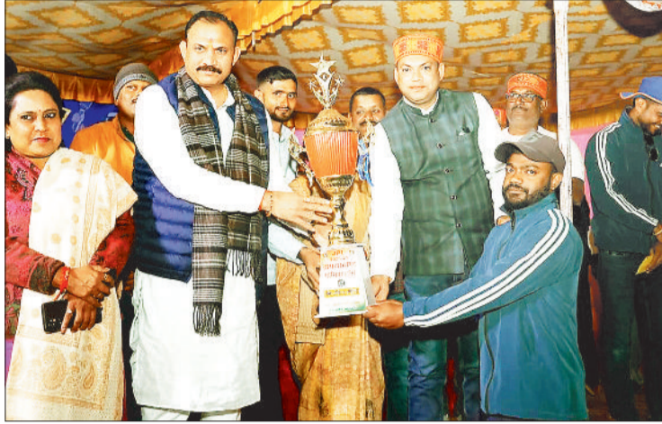
विजेता को शील्ड प्रदान करते स्वास्थ्य मंत्री।

प्रतियोगिता का फाइनल मुकाबला वार्ड क्रमांक 2 और वार्ड क्रमांक 11 के मध्य खेला गया, जिसमें रोमांचक और संघर्षपूर्ण खेल के बाद वार्ड क्रमांक 11 ने जीत दर्ज करते हुए प्रतियोगिता का खिताब अपने नाम किया। इस क्रिकेट प्रतियोगिता में नगर के 15 वार्डों की टीमों के साथ प्रेसिडेंट इलेवन की टीम ने भी हिस्सा लिया। इस प्रकार कुल 16 टीमों ने प्रतियोगिता में भाग लेकर खेल भावना, अनुशासन और प्रतिभा का शानदार प्रदर्शन किया। प्रारंभिक मुकाबलों से लेकर सेमीफाइनल और फाइनल तक दर्शकों में खासा उत्साह देखने को मिला। फाइनल मुकाबले में दोनों टीमों ने बेहतरीन प्रदर्शन किया, लेकिन अंततः वार्ड क्रमांक 11 की टीम